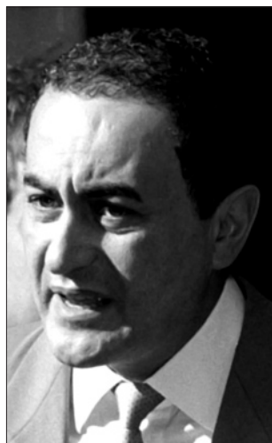
Dodijs (Imads al Fajeds)

Tagad Diānas izvēle bija Dodijs. Laimīgais pāris visu brīvo laiku pavadīja kopā. Un pilnīgi saprotami ir paparaci neatlaidīgie centieni iegūt pikantus kadrus. Starp citu, lēdija Diāna tika