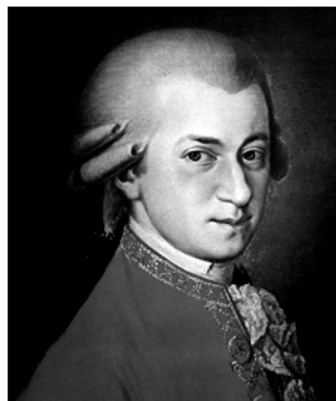
Wolfgang Amadejs Mocarts

Nesen, 2006. gada 27. janvārī, visā pasaulē atzīmēja Volfanga Amadeja Mocarta 250. dzimšanas dienu, godinot viņa mākslas diženumu. Taču Mocarta dzīve slēpj vairākas miklas. Komponists nomira ļoti jauns, nepilnu 36 gadu vecumā. Un tūlīt pēc viņa nāves izplatījās versija, ka Mocarts nav miris dabīgā nāvē. Nedēļu pēc viņa apbedīšanas Vīnes avīze «Mūzikas nedēļas lapa» publicēja rakstu, ka varbūt Mocarts ticis noindēts. Šī vēsts ātri aplidoja visas Eiropas pilsētas. Aizdomas krita uz itā-