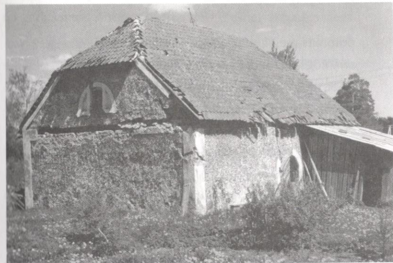
Labības klēts – saglabāta no Sīkšņu muižas aīzsākumiēm. Celta 1827. gadā.

Vārdu var skaidrot dīvējādi: 1. Voklīze – ģeol. spēcīgi avoti, kuri laužas cauri mīkstiēm īežiēm (kaļķakmens,