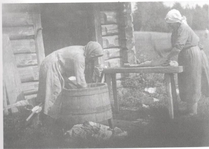
Veļas diena pirtspriekšā. 1920. gadi.

Viss it kā kārtībā. Vēl skanīgi baļķi viz ārpusē kā