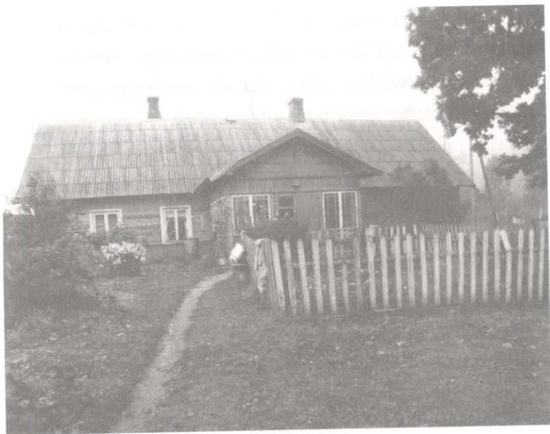
Ilgupju māja. Skats no lielceļa.

laikmetā un vairākreiz vienā paaudzē pārveidots, jaukts, celts, putināts un zudis. Ilgupēs no katra kas palicis.