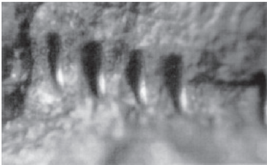
2. att. Uzņēmums tuvplānā – iežu analīzei jāatklāj mikla.

līdzīgi piemēri. Itin visās vēstures fakultātēs notiek lāpīšana un labošana. Dzīres ķeceriem. Sagrauve ekspertiem.